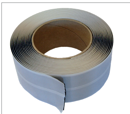
DAFA Multi Sealing