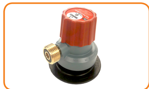
Regulator for click-on (tilkøbes)