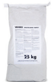
25 kg sæk DB nr.: 5267693