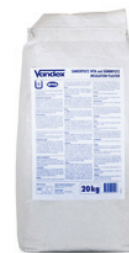
20 kg sæk DB nr.: 5136187