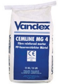
25 kg sæk DB nr.: 1935253