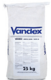
25 kg sæk DB nr.: 5267694