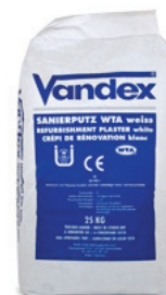
25 kg sæk DB nr.: 5015940