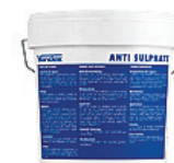
14 kg spand DB nr.: 7961048