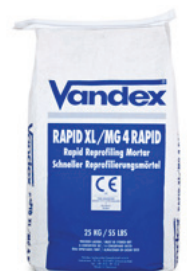
25 kg sæk DB nr.: 5267695