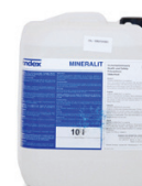
10 liter dunk DB nr.: 7961022