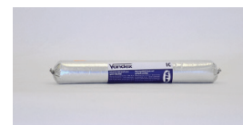
600 ml fugepose DB nr.: 1411960