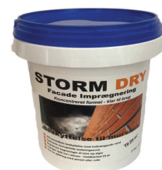
5 liter spand DB nr.: 1438931