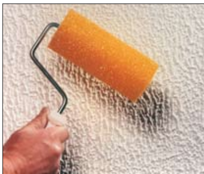
Interiør-GROV, påført med strukturrulle.