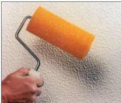
Interiør-FIN, påført med strukturrulle.

Strukturen bestemmes dels af konsistensen, dels af værktøjsvalg, samt af påføringsmetode. Det vil sige at næsten kun fantasien sætter grænser for den struktur man kan opnå.