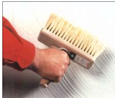
Interiør-SAND, påført med kost.